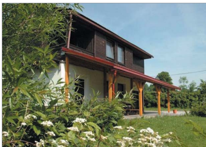
Penzion s 16 lůžky v pěti pokojích

Samozřejmě sklízejí a suší seno a senáže pro svá zvířata. Obilí prodávají. S ekologickým hospodařením začali v roce 2006, až po pozemkových úpravách, protože do té doby hospodařili na směněných pozemcích. Jako zelenou perlu mají ve vlastnictví lesní loučku, kde se vyskytuje chřástal polní a chráněný vstavač osmahlý. Je to jedno ze dvou míst výskytu tohoto druhu vstavače v republice. Péči malíčkému území ale věnuje především KRNP.