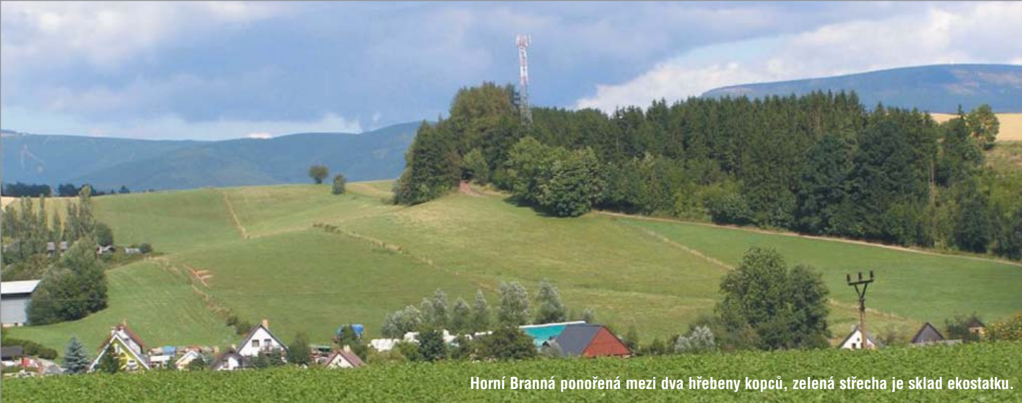
Horní Branná ponořená mezi dva hřebeny kopců, zelená střecha je sklad ekostatku.