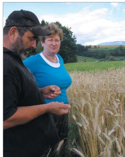
U pole s tritikale

➤ (Více zde: http://pro-biokrkonose.webnode.cz/o-nas/ .)